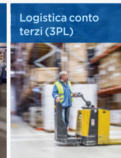
Logistica conto terzi (3PL)