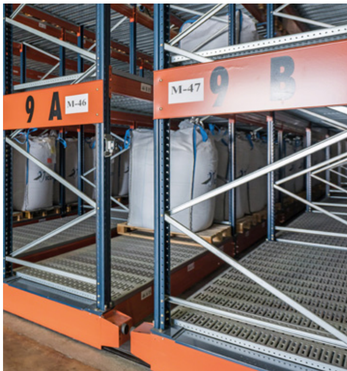
Fotocellule di prossimità

Uno dei principali vantaggi delle scaffalature Movirack è il notevole aumento del volume di stoccaggio grazie allo sfruttamento dello spazio disponibile