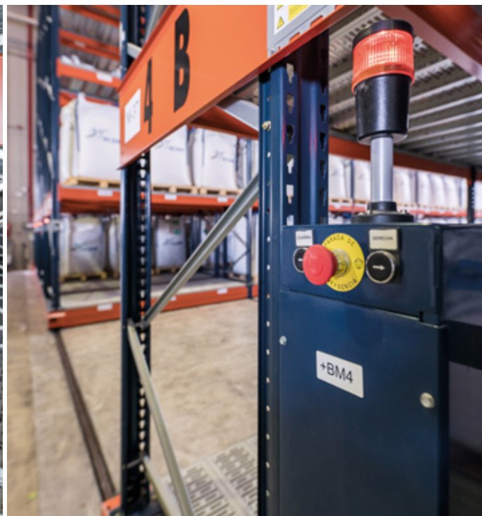
Funghi di emergenza